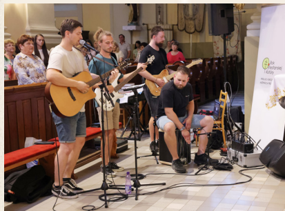
Spevácky zbor jUnity, Hlohovec.

končil sám zatvorený v studenej cele, zobrali mu všetko, aj šaty. Práve v tejto situácii si uvedomil, že jednu vec mu zobrať nemôžu – jeho vnútornú slobodu. „Medzi podnetom, ktorý prichádza zvonka, a mojou odpoveďou je vždy priestor slobody. Ja sa rozhodujem, ako reagujem na okolnosti okolo mňa v tomto intervale slobody,“ hovoril Frankl. Aj keď sú tie okolnosti ťažké, môžem sa postaviť a povedať, čo ja môžem urobiť, ako môžem žiť svoju slobodu aj v tejto náročnej situácii. Frankl sa stal neskutočne vnútorne slobodným, inšpiroval mnohých väzňov a dokonca niektorých dozorcov. Po vojne založil psychoterapeutický smer, ktorý vo-