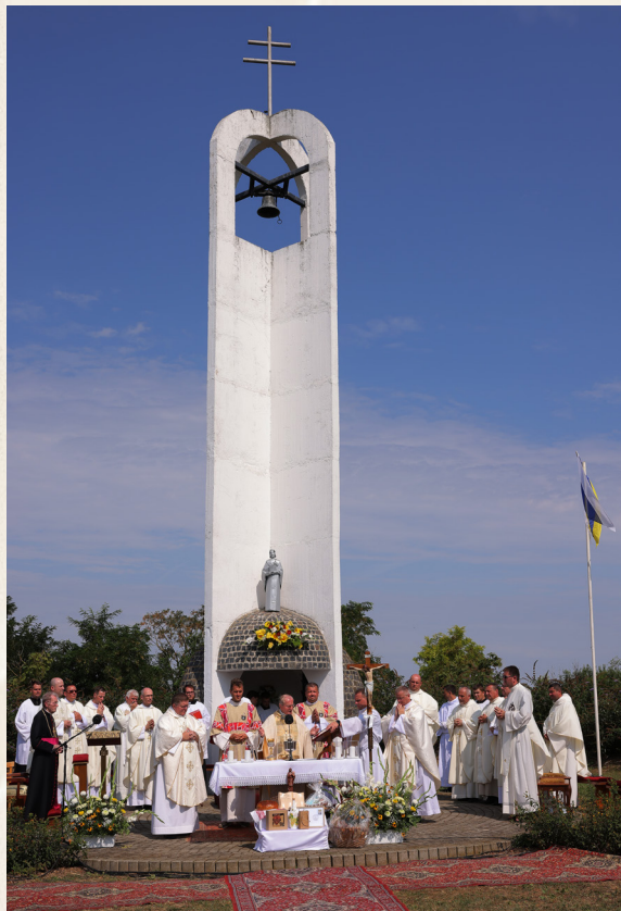
Kaplnka sv. Gorazda v Gorazdove.

„Keď sme sa rozhodli, že chceme na počesť sv. Gorazda niečo urobiť a vystaviť aj kaplnku, tu v jeho rodisku, tak myšlienka bola pekná, ale bolo treba peniaze, ľudí a všetko to zorganizovať. Peňazí nebolo, ale pomohla nám jedna vec.