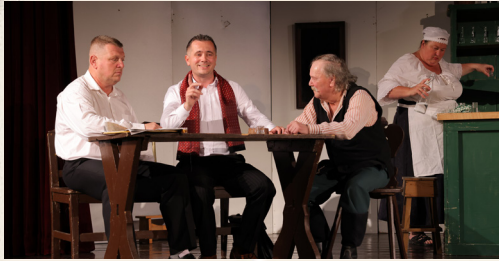
Rómeo a Júlia.