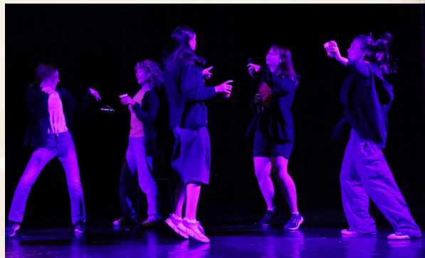
Tam, kde číha vlk.

Izraelská spisovateľka Aje- let Gundar-Gošen vo svo- jom psychologickom ro- máne Tam, kde číha vlk tematizuje veľmi aktuálne otázky imigrácie, identity, rasizmu a z toho plynú- ceho násillia, ale aj otázky o vzťahu rodičov a detí, po-