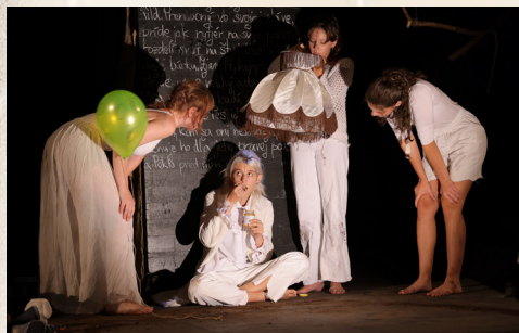
Evanjelium o konci sveta.

Modré divadlo pod vedením Štefana Foltána si za predlohu k svojej inscenácii vybralo knihu Dobré znamenia od autorov fantasy literatúry Neila Gaimana a Terryho Pratchetta, ktorá humorným jazykom tematizuje prípravu na koniec sveta. V inscenácii je citeľný vplyv kolektívnej dramatisácie, ktorá sa zamerala na vybrané témy, o ktorých