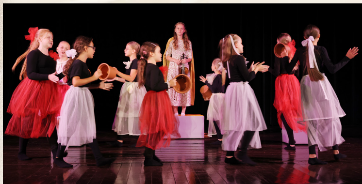
DS Gašparko z Lendaku vystúpil s hrou Najkrajší kvet.