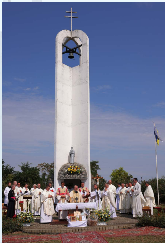
Kaplnka sv. Gorazda v Gorazdove.