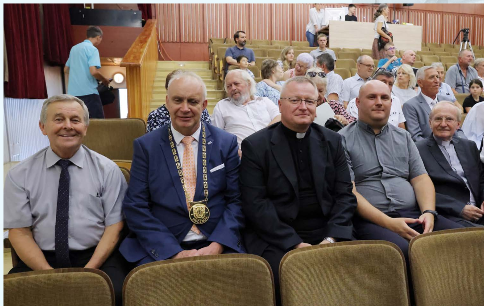
Slávnostné otvorenie festivalu sa uskutočnilo v kultúrnom dome v Močenku.