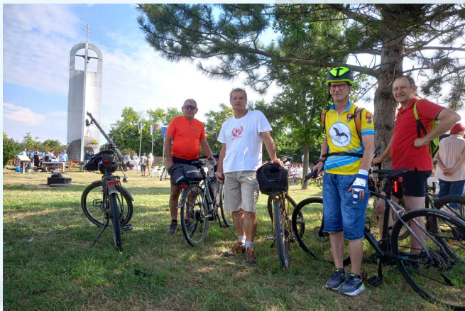
Cyklopútnici prišli od Kostola sv. Gorazda v Nitre ku Kaplnke sv. Gorazda v Gorazdove.