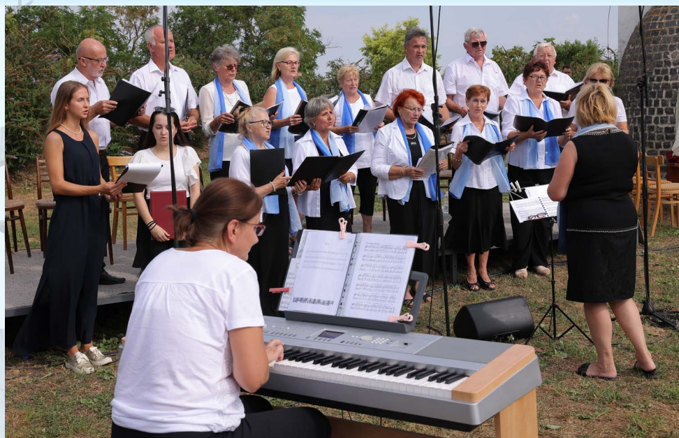
Spevácky zbor CANTUS pri kostole sv. Michala, Zlaté Moravce.