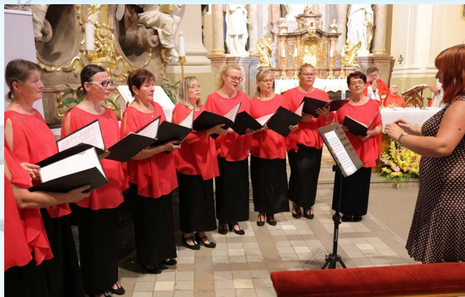
Počas sv. omše spieval Ženský spevácky zbor Cantica, Močenok.