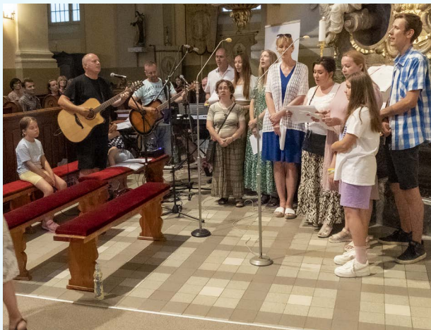
Počas sv. omše a záverečnej adorácie spieval Spevácky zbor Slnkom odetí z Cabaja-Čápora.