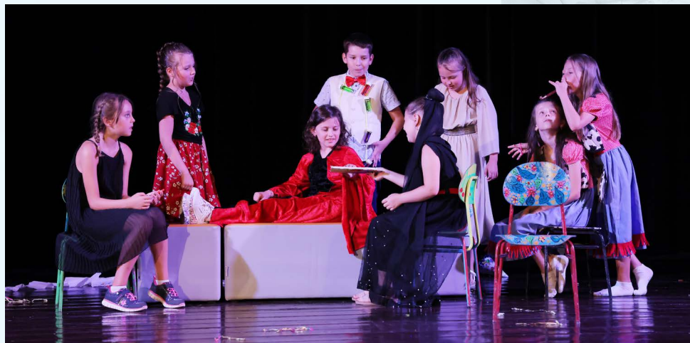
DS Minót, Topoľčany