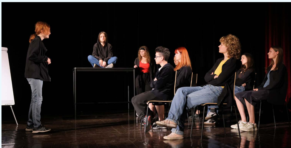
DS Datív, Nitra