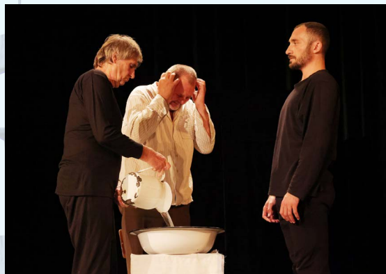
DS Či-pr-cha z Kremnice

Divadelný súbor Či-pr-cha z Kremnice siahol po predlohe držiteľky Nobelovej ceny za literatúru Svetlany Alexejevič „Príbehy zo second handu“, ktorá prináša reportážny pohľad na skutočnú tvár komunistického režimu v Sovietskom zväze formou rozhovorov či už s priamymi aktérmi krutého režimu alebo ich príbuznými.