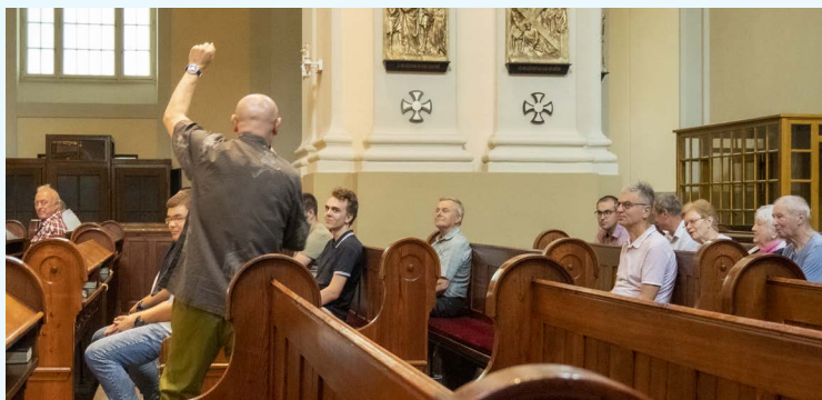
Duchovná obnova mužov zaujala.