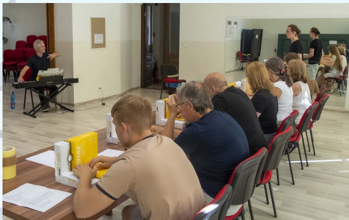
Skúška tvorivej dielne.