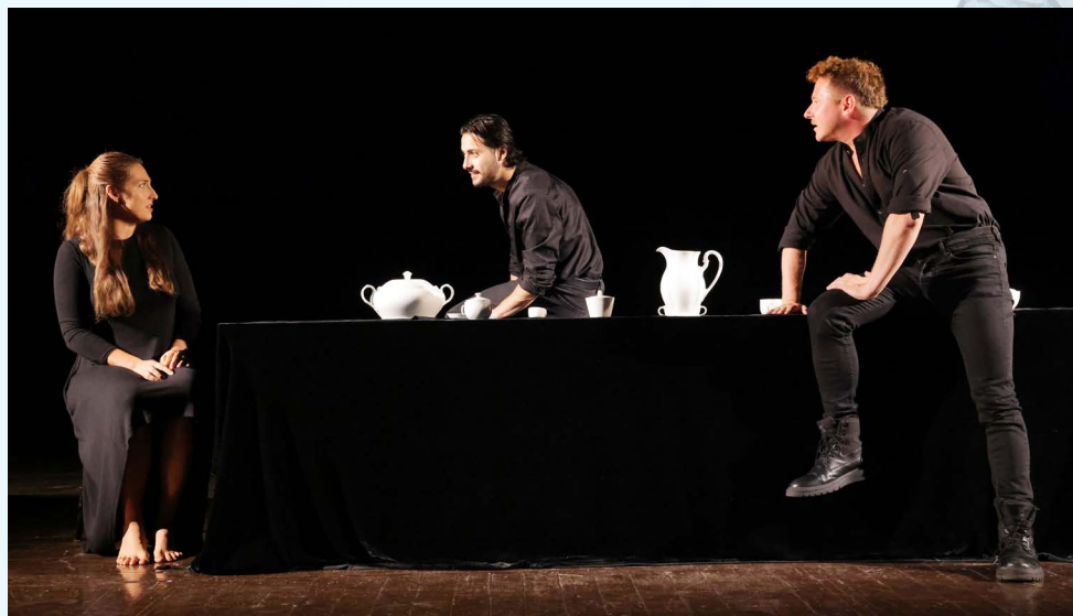
Teatro Colorato, Bratislava.

„Snažili sme sa zachytiť vnútornú podstatu bolesti a boja jednej matky, ktorá v nezmyselných „jatkách“ prišla o svoje deti. Či to bolo kedysi v dobe narodenia Krista, alebo dnes, bolesť zo straty je rovnaká. V inscenácii sme sa však snažili vyhnúť pátosu, ku ktorému táto téma prirodzene zvädza a poukázať skôr na vnútorný proces, ktorý sa odohráva