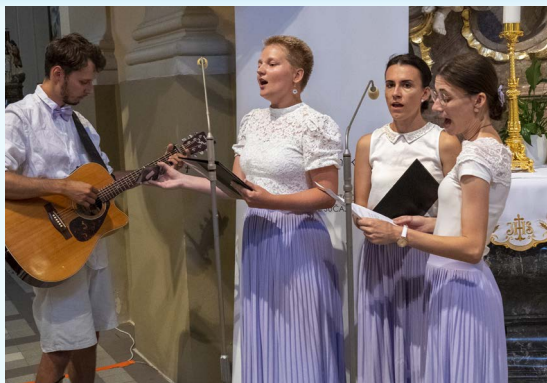
Spieval spevácky zbor zo Šale.