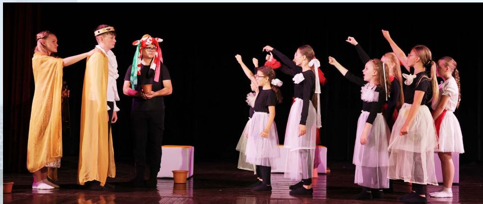
DS Gašparko, Lendak