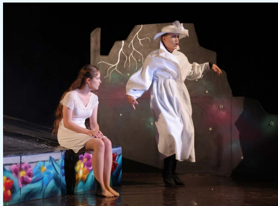
DS na SKOK z Raslavíc

Ako aj otázkou, ktorá v dnešnej spoločnosti rezonuje čím ďalej tým nástojčivejšie. Konceptia hereckých premien dvoch hercov je zvolená nenásilne, režisérovi sa darí vystihnúť kľúčové