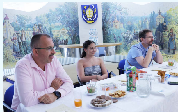
Členovia festivalovej poroty.

Ak je v súčasnosti spoločenskou potrebou volanie po zmierení, upokojení nenávisťi, akceptovanie názoru inej strany – divadlo akoby úplne prirodzene reflektuje túto atmosféru a tvorcovia svojším spôsobom prenášajú tieto témy i na javisko. O čo viac v rámci platformy, ktorá má 'kresťanský' už v samotnom názve. Taký bol aj XXXII. ročník celonárodného festivalu kresťanského divadla Gorazdov Močenok 2024.