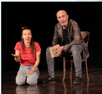
Art VAMO Žilina.