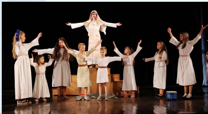
DHS Podzámok a SZ Sinaj „12“

Tvorcovia si zvolili za motív svojho hudobno-scénického diela biblické číslo dvanásť. Rozpracúvajú príbehy dvanástich apoštolov, dvanásťročnej Jairovej dcéry, ženy trpiacej dvanásť rokov na krvotok. Hudobná štruktúra piesní je vcelku nápaditá, dôležité je rozlíšiť, či ide o skladby pre hudobno-dramatické dielo, alebo o „pesničky“. V pesničkách určených pre javiskové dielo treba uvažovať v rovine dramatickej, v rovine tvorby dialógu v hudbe, v rovine prerozprávania príbehu. Prílišné opakovanie refrénu pôsobí nadužívané. Súbor je disponovaný muzikálne, spevácky ale aj herecky.