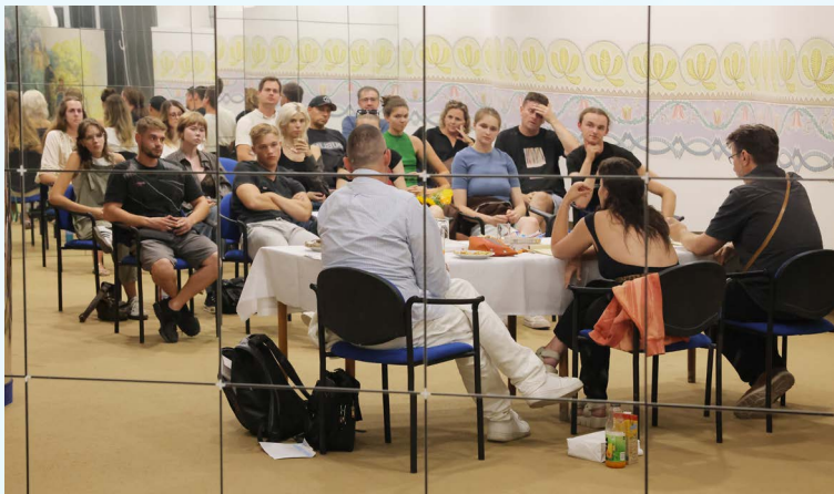
Hodnotenie súťažného predstavenia.