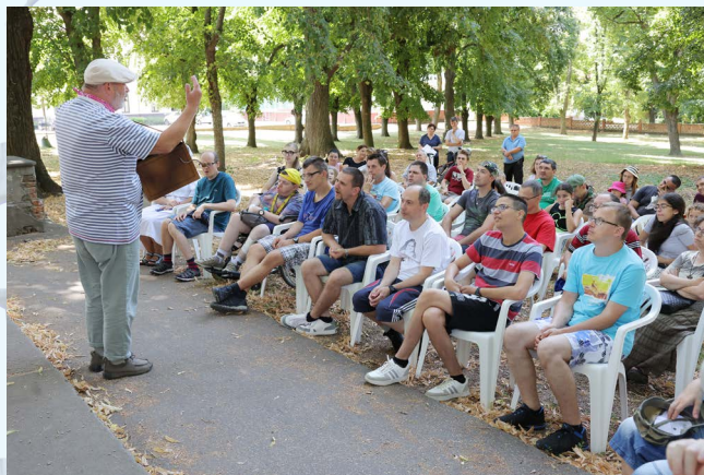
Tyjátr účinkoval v parku pred kostolom.