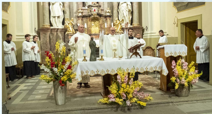
Sv. omša 22. júla

použitý ako základ pre zamyslenie o nájdení lásky a osobnej spásy. „Naša som, koho moja duša miluje,“ zaznelo v prvom čítaní z Piesne piesní. Kazateľ povzbudil veriacich, aby sa zamysleli nad tým, či už našli túto lásku a ďakovali Pánu Bohu za ňu. Tým, ktorí ešte hľadajú, odporučil vložiť svoje túžby do modlitby s prosbou, aby našli toho, koho ich duša bude milovať.