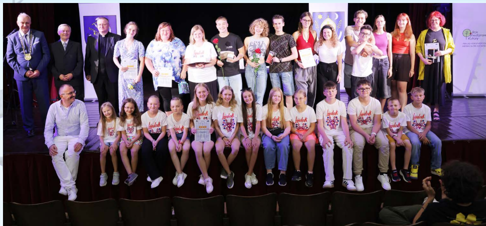
Najúspešnejšie súbory festivalu Gorazdov Močenok 2024.