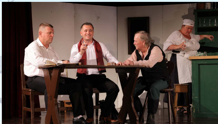
DS Staškovan, Staškovany.