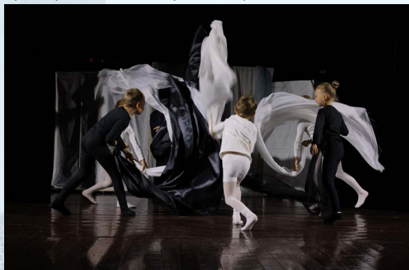
DS Potôčik z Nitry.