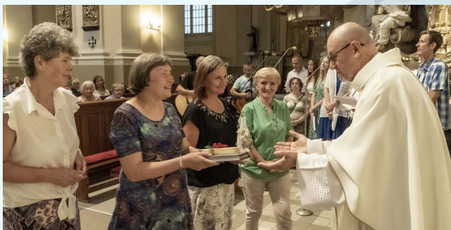
Prinášanie obetných darov