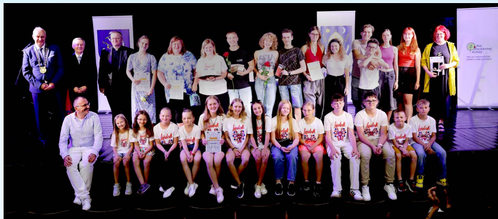
Vítané súbory a jednotlivci po vyhodnotení festivalu.