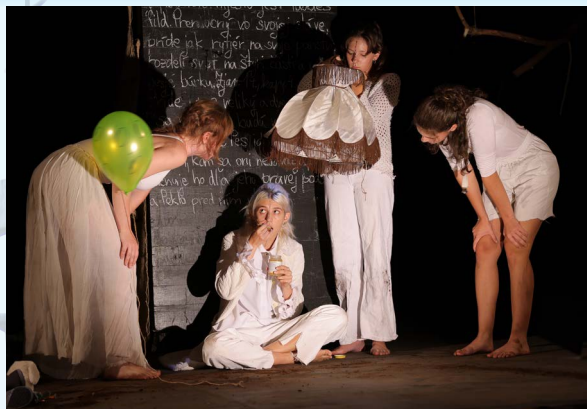
Modré divadlo Vráble