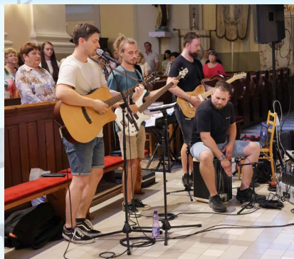
Spevácky zbor jUnity, Hlohovec.