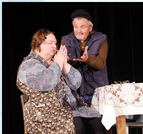
DS Família, Cabaj-Čápor

DS Família z Cabaj-Čápora priniesol v inscenácii Tam, kde sa nebo dotýka zeme, in-