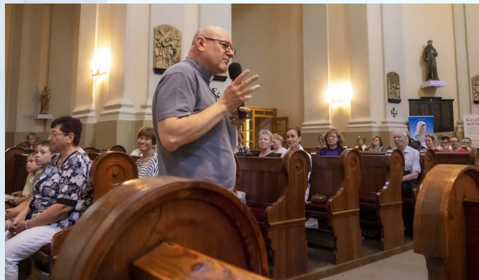
Duchovná obnova pre ženy