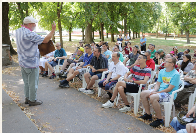
Tyjátra účinkoval v parku pred kostolom.