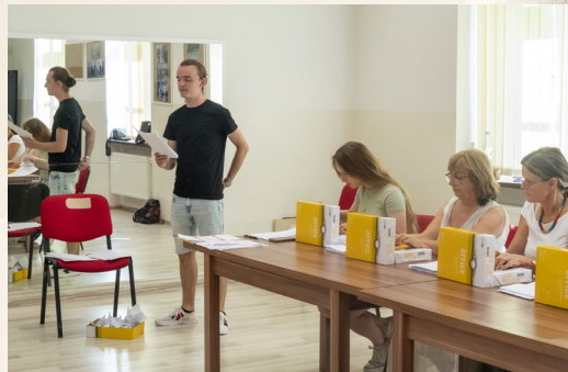
Účastníci tvorivej dielne