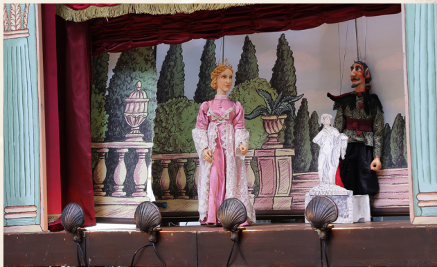
Hercules v podaní Tyjátra.