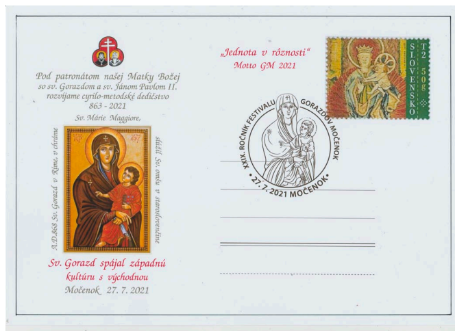
foto Príležitostnej poštovej pečiatky „29. ročník festivalu Gorazdov Močenok“

V uvedenej bazilike pápež Hadrián II. s veľkou úctou prijal byzantskú misiu sv. Cyrila a Metoda so sv. Gorazdom a ďalšími učeníkmi, lebo mu prinášali relikvie sv. Klimenta, pápeža a mučeníka. (Pozri vzácny obraz v chráme sv. Klimenta v Močenku.) Tu pápež prijal knihy Svätého písma a povýšil staroslovenský jazyk na liturgický jazyk ako štvrtý na svete popri hebrejskom, latinskom a gréckom a prikázal biskupom Formosovi a Gauderikovi, aby vysvětili za kňaza Metoda, Gorazda a ďalších učeníkov. Bol to veľký deň, čo učinil Pán pre Slovákov a všetkých Slovanov. Budme naň hrdí, ale aj vďační Pánovi za tento veľký dar. Novokňazi celý týždeň s veľkou radosťou slávil sv. omše po slovensky a nadšené spevy sa ozývali Rímom. Už tu sa prejavila jednota v rôznosti, požehnaná samotným pontifikom.